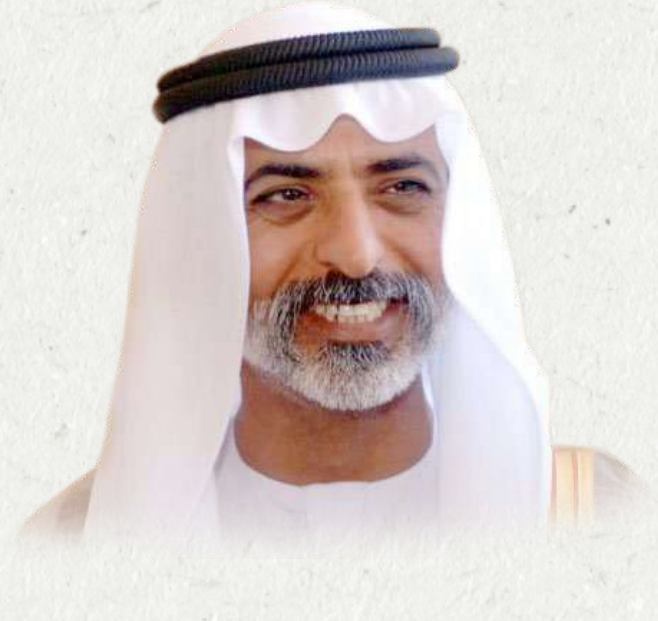
معالي الشيخ نهيان مبارك آل نهيان عضو مجلس الوزراء، وزير التسامح والتعايش رئيس مجلس إدارة صندوق الوطن